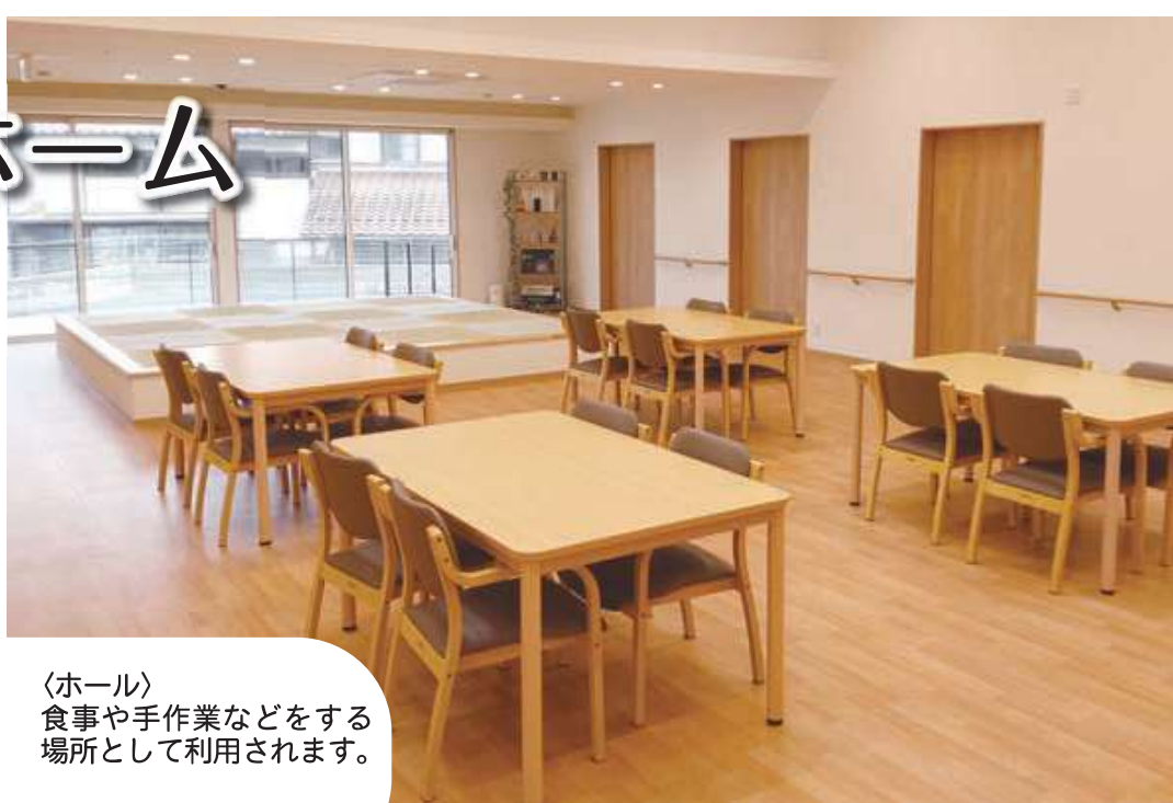
〈ホール〉 食事や手作業などをする場所として利用されます。