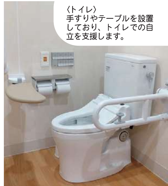
〈トイレ〉 手すりやテーブルを設置しており、トイレでの自立を支援します。

越しの際にはぜひお立ち寄りください。 施設見学も出来ますので、近くにお ればと考えております。 となり、地域に開かれた施設にな