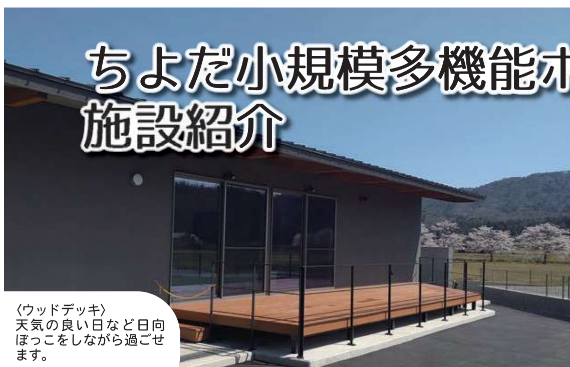
〈ウッドデッキ〉 天気の良い日など日向ぼっこをしながら過ごせます。