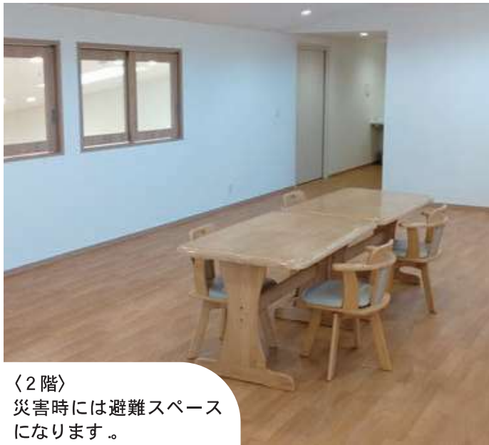
〈2階〉 災害時には避難スペースになります。