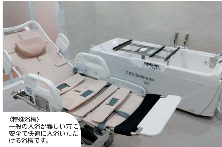
〈特殊浴槽〉 一般の入浴が難しい方に安全で快適に入浴いただける浴槽です。