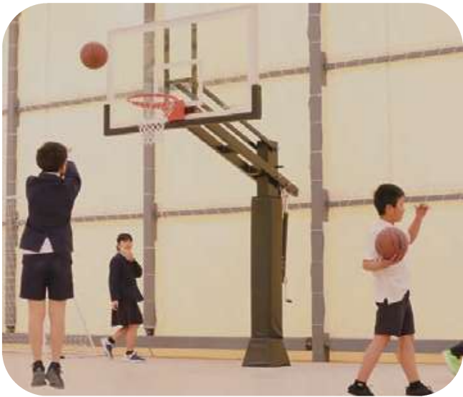
▲時習堂で勉強したあと体育館で遊ぶ子どもたち

屋内型の施設なので雨風がし のげて季節を問わず幅広い年齢 の方々が利用できると思います。 職員の福利厚生での活用や地域 の方々が利用できるようにと思 っています。将来運動教室が明和 会グループで主催できたらとも 考えています。高齢者の方々、子 供達を含め地域の皆様の健康の 助けになり、愛される施設となる ように願っています。